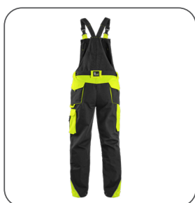
zadní strana back side z tyłu