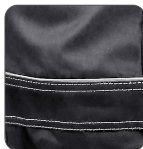
reflexní doplňky reflective accessories elementy odblaskowe