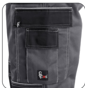
multifunkční kapsy multifunctional pockets kieszenie wielofunkcyjne